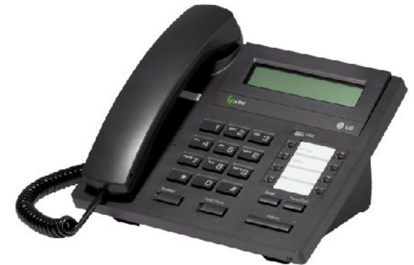
LDP-7008D Guía rápida de uso

Muchas gracias por adquirir el teléfono LDP-7008D de LG-Nortel. En esta guía podrá encontrar toda la información acerca del uso de su teléfono. Tenga en cuenta que los códigos que aparecen en esta guía pueden ser diferentes dependiendo de la programación de su sistema. Consulte al Administrador del mismo si encontrara algún problema.